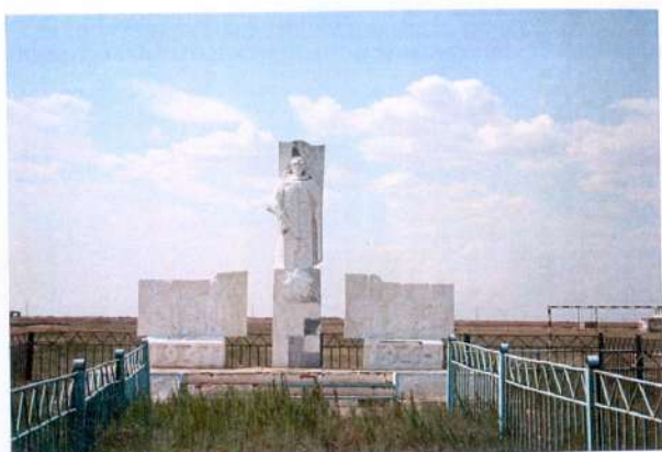
ҮОС қатысушыларына ескерткіш. Северный ауылы. Памятник участникам ВОВ. п. Северный.