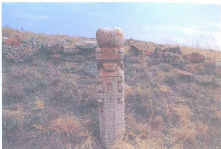
Байбосын мазары Мазар байбосына