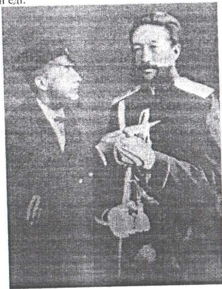
Ғұбайдолла Жәңгіров («Айбын» энциклопедиясынан)

1879 жылы соғыстың ауыр, қиын-қыстау күндері әсер ете сүзекпен ауырған сұлтан Жәңгіров соғыс ісімен біржолата қош айтысады, әкімшілік қызметке ауысқан соң Александр III патшаның тәж кию рәсімінде «барлық азиаттық депутацияны бастап» құрметті қонақтар қатарында отырады. Әскери істен кеткен Ғұбайдолла Жәңгіров 1885 жылдың 23 ақпанында патша жарлығымен Ішкі істер министрі боп Қырымдағы вакфтық (уақып) жер иеліктері бойынша Арнаулы комиссия төрағасы боп тағайындалады. Жәңгіров бастаған комиссия құрамы бұл аймақтағы үкімет мүшелері, шенеуніктердің жерді талан-таражға салғанын, мұсылмандарға тиесілі жер иеліктері жүйесінің бұзылуын, мешіт пен медреселердің ахуалы төмендегенін, жалпы жерге байланысты іс-қағаз жұмыстарының жоқтығын анықтап, Петербургтегі патша мен Сенатқа шұғыл түрде хабар береді. Бұл комиссияның құрамына ең үздік вакфтық құқық мамандары, тілмаштар, жер мамандары, картографтар мен заңгерлер таңдалып алынғандықтан жергілікті ірі жериеленушілер сотта жеңіліс тапты, оның үстіне Тавриялық мұсылман басқармасына жылжымайтын мүлікті иелену құқығы қайтарылды. Дәл осы кездері паракор шенеуніктер өз мүдделеріне қайшы Ғұбайдолла Жәңгіровтің үстінен Петербургке түрлі шағымдар, домалақ арыздар жіберген еді.